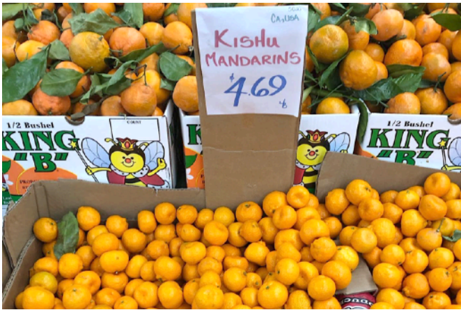
サンフランシスコで売られている紀州みかん

苗木の旅の里親のみなさん、こんにちは。紀南アートウィークで、企画に関わらせてもらった五十嵐純です。僕は今、12月からの1年間、美術の研修でアメリカ西海岸のカリフォルニア州のサンフランシスコの近くの街に住みはじめました。カリフォルニア州は、ネーブルやバレンシアなど日本でも有名な柑橘の産地でも有名な場所ですが、なんと先日行ったスーパーでは写真のように「Kishu mandarine (紀州マンダリン)」が一番目立つところに山積みになってました！調べてみたら「種がなく、子どもが自分で食べても大丈夫なため、特に親御さんに愛されています。」とあり、もちろん買って食べてみましたが、甘くてホッとする味でした。今後もアメリカ柑橘情報をお届けしたいと思います！みなさま良い年末年始をお過ごしください！