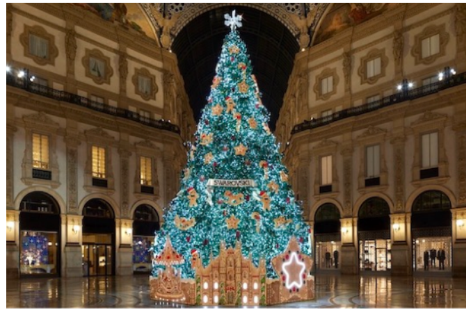
ミラノ中心部にあるアーケドのクリスマスツリー

みかんの苗木の里親になっていただいたみなさんと、コミュニケーションをとるための手段として、緩やかなツール、通称「みかん通信」を立ち上げることになりました。みかんの豆知識、みかんや苗木の育成、農業、参加者の近況や日常なことなど、このみかん通信を通じて、今後も連絡を取り合い、情報を共有をしていく予定です。特に「コモンズの農園」という場所が開かれるまでは、なかなか直接お会いする機会も少なくなるので、このみかん通信がそれに変わるものとなります。創刊号はみかんの苗木の育て方などについて簡単にお知らせし、次号以降は寄稿いただいたコラムやみなさまからの質問事項、近況（私の苗木）など、みかんに関する気になることなど、ご返信いただければこの通信に反映していく予定です。また、みかんコレクティブの農家のメンバーからもより有効な生育アドバイスなどの配信や今後の「コモンズの農園」の展望や準備近況なども順次お知らせしていければと思います。