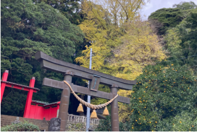
八幡宮来宮神社

す。さらに驚くべきことに、異なる柑橘種の挿し木を挿しても、同じ木の根っこから、異なる柑橘が育っていくというのです。しかも、ひとつの種に複数の柑橘がなることも可能といいます。この話は衝撃的でした。たとえば温州みかんの木に、挿し木をしていけば、八朔もぽんかんも甘夏も育つというのです。なんという受容性、なんという心の広さでしょう。やはり、みかんはおおらかな植物なのでしょう。