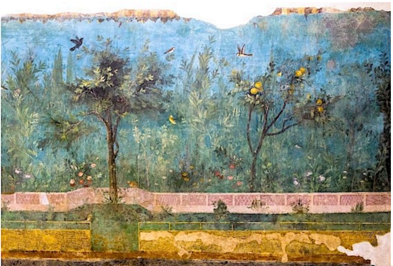
L'affresco della Villa di Livia, Palazzo Massimo alle Terme, II secolo a.C.

ローマの時代に描かれたフレスコ画。柑橘類は豊かさの象徴としてすでに古代より描かれてきた。