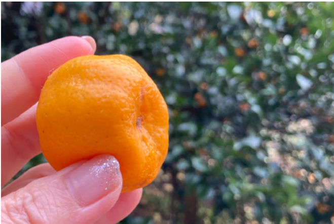
原生種のみかん

す。さらに驚くべきことに、異なる柑橘種の挿し木を挿しても、同じ木の根っこから、異なる柑橘が育っていくというのです。しかも、ひとつの種に複数の柑橘がなることも可能といいます。この話は衝撃的でした。たとえば温州みかんの木に、挿し木をしていけば、八朔もぽんかんも甘夏も育つというのです。なんという受容性、なんという心の広さでしょう。やはり、みかんはおおらかな植物なのでしょう。