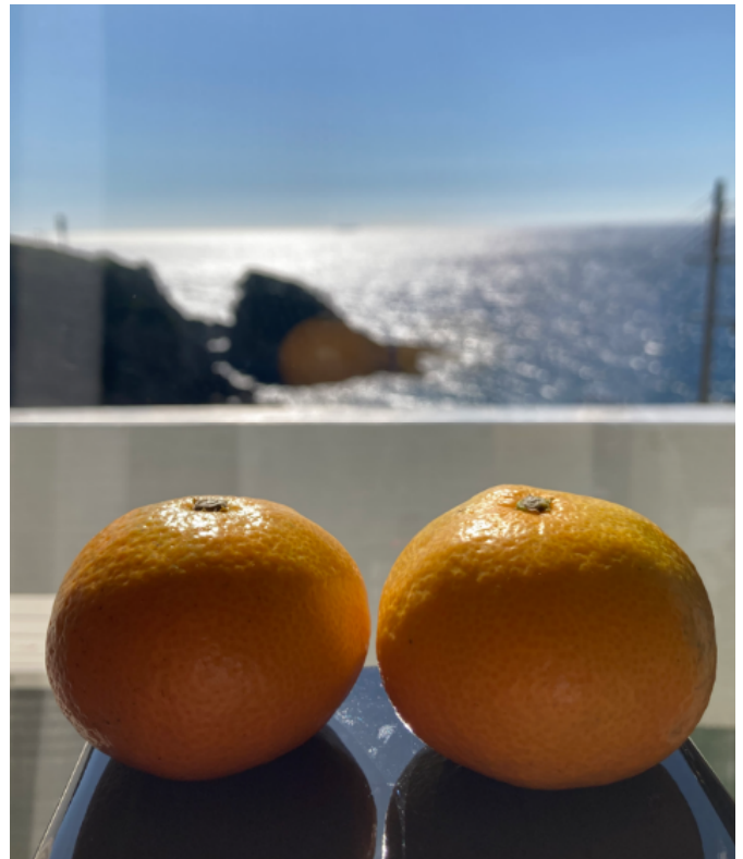
白浜の海をながめるみかんたち

今年12月に、伊豆半島の伊東で、原生種と言われるみかんを食べる機会がありました。八幡宮来宮神社という1300年の歴史がある神社のそばに自生しているみかんの木なのですが、「神社のみかんを勝手に食べていいのかな」と思いながらも、地元の方が取って食べ始めたので、一緒にいた10人位の人たちで、ひとり1個ずつ、いただいてしまいました。野生のためぎにでもなった気分。まさに「コモンズみかん」。驚いたのは、その甘さです。十分に熟していたこともあります。商品にしてもいいくらいでした。もちろん、小さいですし、大きい種もあります。でもこれは、糖分、水分、ビタミンを与えてくれる自然界の極上スイー