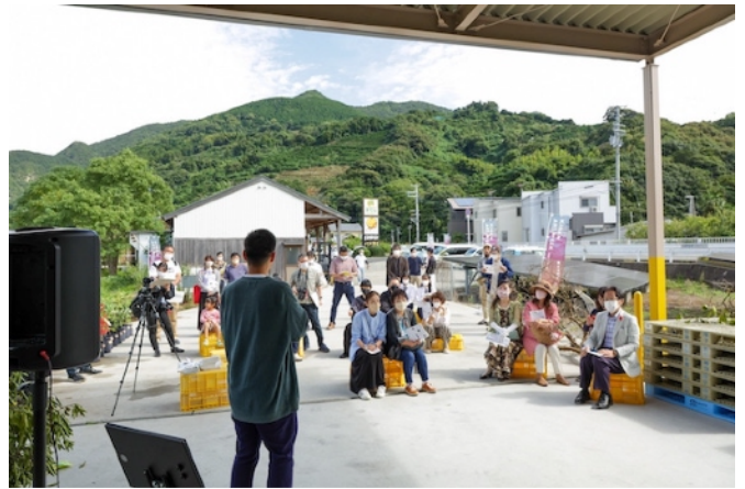
みかんの苗木を配布するイベント

「みかん」には、たくさんの魅力があります。特に、「紀南のみかん」は、圧倒的に美味しいと思います。ただ、その「美味しさ」の先を見てみたいと思って、「みかんマンダラ」展を企画してきました。そして、その「紀南のみかん」には、皆様が思っている以上に、生活と紐ついた言葉化されていない「何か」があるように思います。紀南/熊野という地で、「みかん」を媒介にし、数々の思想家や芸術家の言葉をお借りしながら、「『原理を越えた』みかん」を求めようとした思考の痕跡を『みかんと人間の芸術人類学-「みかんマンダラ」展を終えて-』として執筆しました。その「何か」は、まだまだ掴めそうにないですが、これから皆さんとともに思索し続けたいと思います。来年も、深く、楽しく思考を深めていきましょう！！