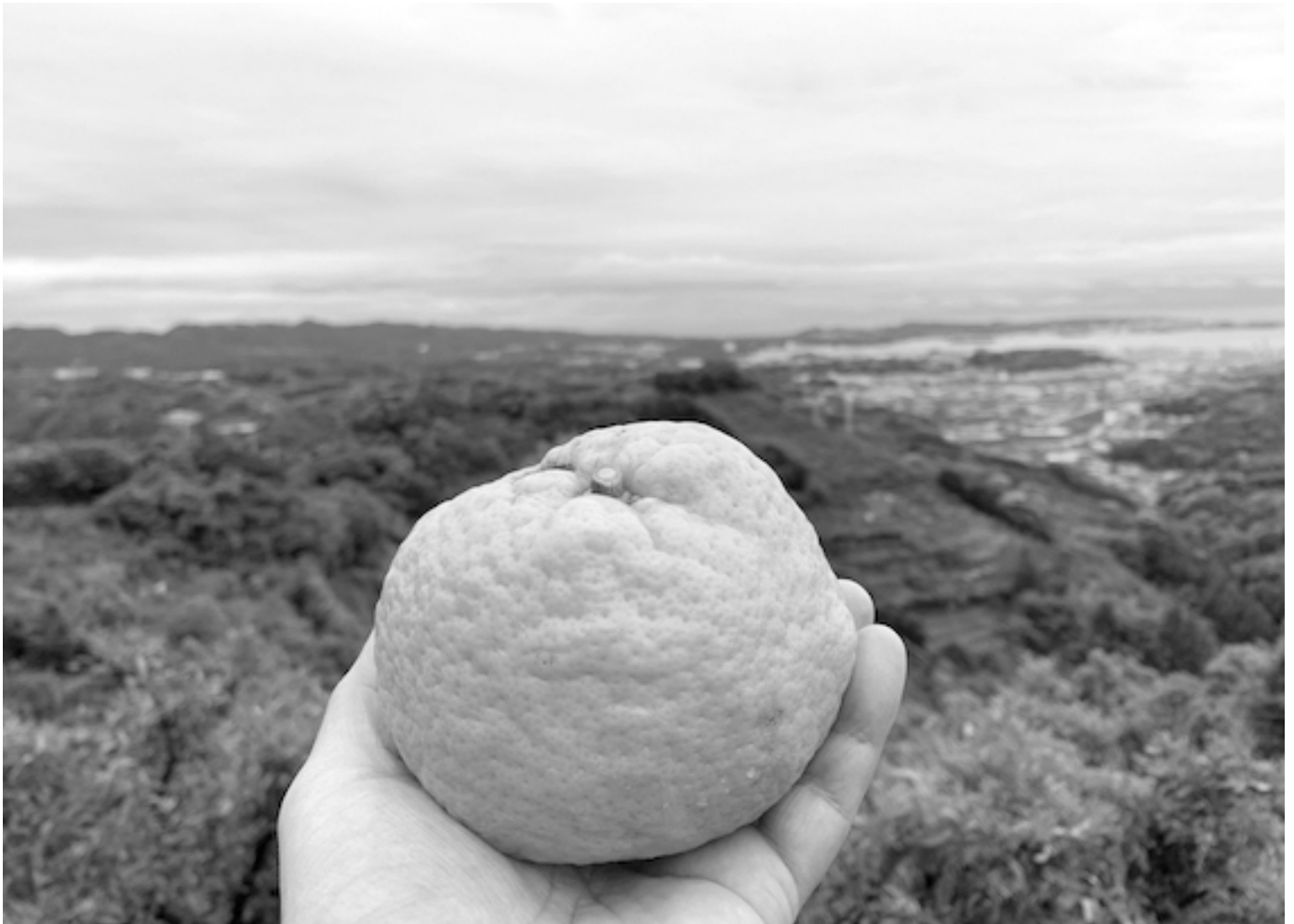
Satoshi Hirose, 無題, 2022